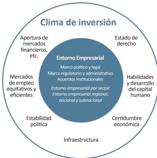
Figura 1: Definición del entorno empresarial

A efectos de esta Guía, el Comité de Donantes para el Desarrollo Empresarial define el entorno empresarial como el conjunto de condiciones políticas, legales, institucionales y regulatorias que rigen las actividades del sector privado. Representa un subconjunto del clima de inversión e incluye los mecanismos de administración y cumplimiento establecidos para implementar la política del gobierno, así como los planes institucionales que influyen en la manera que operan los principales actores (por ejemplo, las agencias del gobierno, las autoridades reguladoras y las organizaciones empresariales, en las que se incluyen las asociaciones de mujeres empresarias, organizaciones de la sociedad civil, sindicatos, etc.). Véase Figura 1.